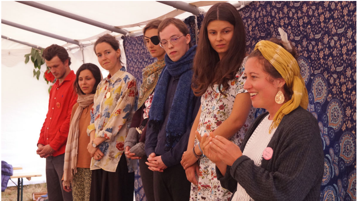
Kernteam bei der Gründungsfeier der Jugendsektion in Deutschland