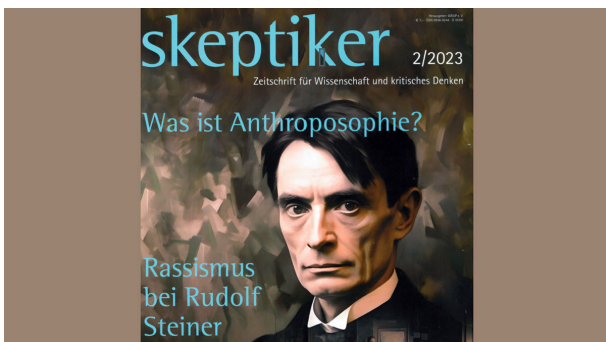
Cover des Skeptiker 2/23 (Ausschnitt)

Der „Skeptiker“ stellt (manchmal) falsche Fragen. Ein Artikel vom Info3-Blog.