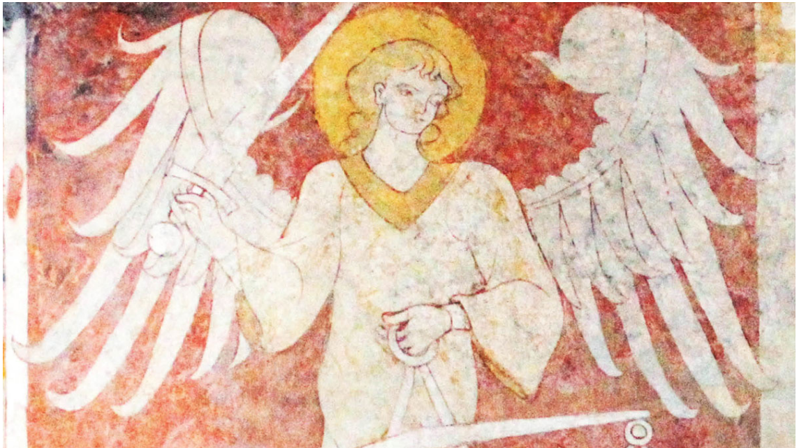
Michael als Seelenwäger. Frühgotisches Fresko im Chor der Basilika St. Michael in Altenstadt bei Schongau.